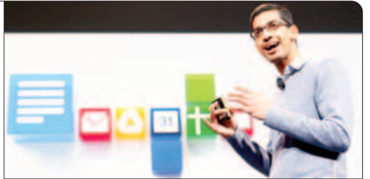
اکنون آندروید در بازار تلفن‌های همراه هوشمند، بیشترین طرفدار را دارد

ما و سامسونگ همکاری بسیار نزدیکی را در سال‌های گذشته در کنار هم داشته‌ایم و تلاشمان بر این پایه بوده که با هم طعم موفقیت را بچشیم. البته شایعه‌های بسیار زیادی در مورد رابطه میان ما شنیده می‌شود ولی واقعیت امر این است که تیم‌های هر دو شرکت هر روز در کنار هم به سختی کار کرده تا تجربه کاربری بهتری را در اختیار مشتریان قرار دهند.